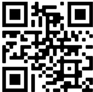
Discord-Server der INΦMa