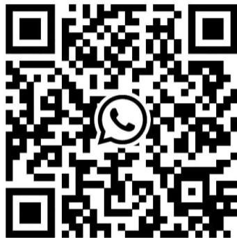
Erstsemester-WhatsApp-Gruppe Wintersemester 2023/24